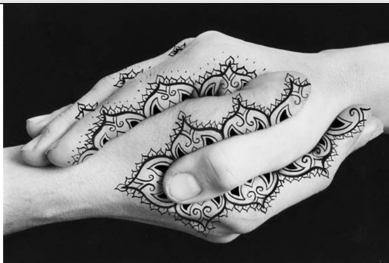
Shirin Neshat. Untitled (Access for All) , 2004