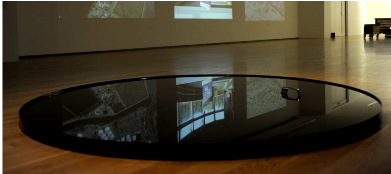
Marcela Armas. Estanque , 2006

Nesta peza de Marcela Armas, o que ten a aparencia dun espello ou superficie pulida é en realidade un 'estanque' de aceite de motor usado no que flota unha agarradoira dunha porta de automóbil.