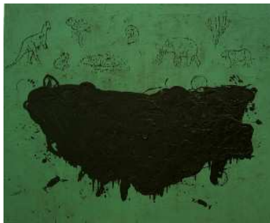
Antón Patiño. Memoria prehistórica , 1987