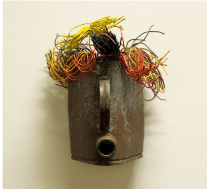
Romuald Hazoumè. Internet , 1997