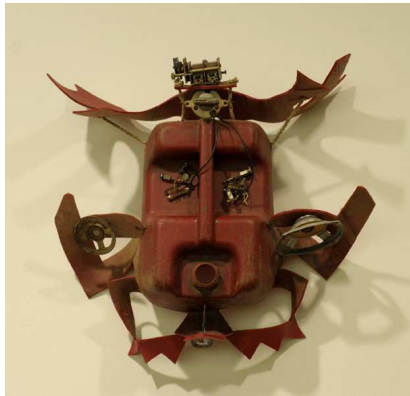
Romuald Hazoumè. Bagdad City , 1992