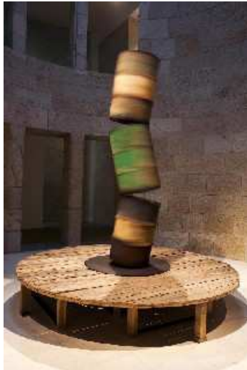
Damián Ortega. Movimiento en falso (equilibrio y sostenibilidad económica) , 1999-2003

A través da obra de Damián Ortega traballamos a percepción visual e auditiva. Relacionamos os seus compoñentes e as sensacións que nos produce con outras que coñecemos. Descubrimos formas xeométricas (o círculo) e debuxámolo co noso corpo en movemento, individualmente e en grupo. Facemos exercicios de equilibrio.