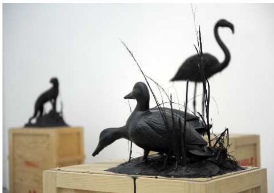
Mark Dion. The Tar Museum [El museo del alquitrán], 2006

Falamos dos distintos animais, pensamos en se os vimos algunha vez en libros, en debuxos, no colexio, noutros museos, etc. Observámolos e preguntámonos se serán de verdade, onde viven, se son acuáticos, se poden voar ou se viven na terra.