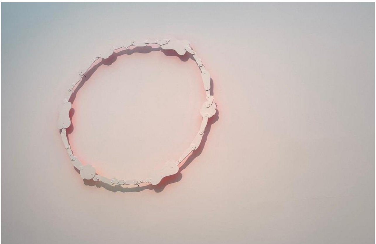
Alberto Ardid. Eppur si muove , 2017 Acrílico sobre madeira. 2,10 m de diámetro

Coma se se tratase dun relato en secuencias, o segundo patio ofrece unha imaxe primeira próxima, familiar, cun palleiro e alusións a unha paisaxe e un sol (Universo), que axiña se transforman en escenario de debate. Descubrimos outras interpretacións posibles: a paisaxe é pancarta, dende o palleiro dispárase. Algunhas accións son máis íntimas, como a tentación agochada no cuarto da limpeza, ou a máquina que prega insistente ao espectador que a desconecte.