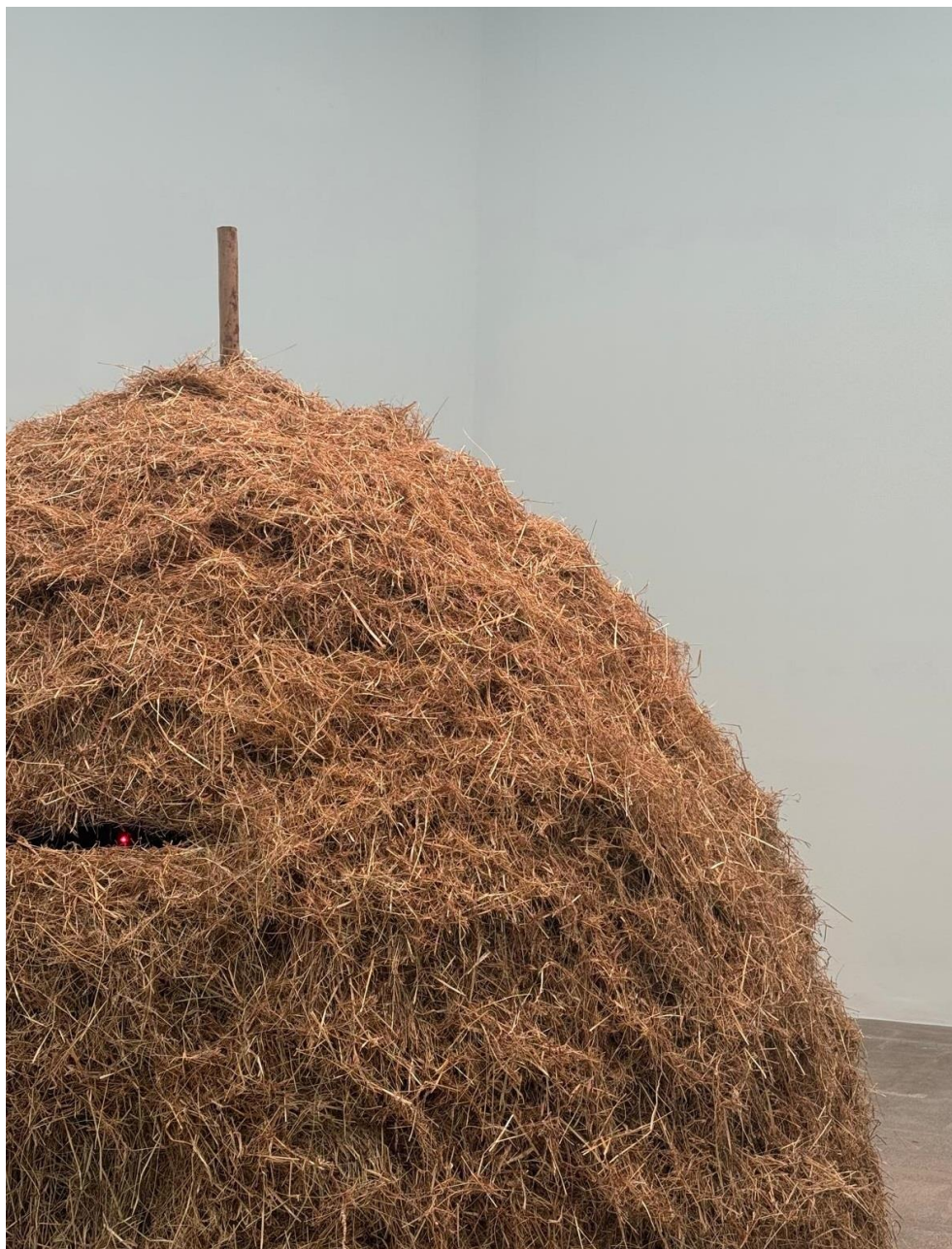
Alberto Ardid Sen título , 2026 Instalación 4,90 x 4,90 x 3,50 cm