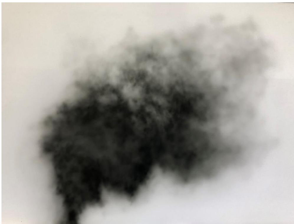
Bosco Caride. Sin título , 2023. Óleo sobre papel, 29,7 x 42 cm.