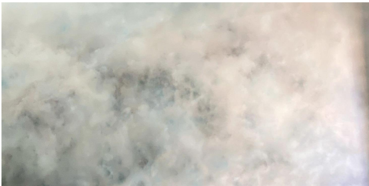
Bosco Caride. Sin título , 2024. Óleo sobre tela, 195 x 400 cm.

Son piezas que son capaces de hacernos proyectar, capaces de hacernos ver, de comunicarnos una perspectiva de la realidad, del tiempo en el que vivimos. Proyectar en la nube algo que ahí no está.”