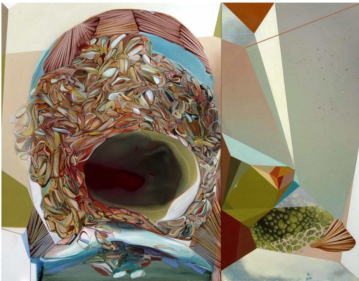
Daniel Verbis. Pánico icónico (In The Court Of The Crimson King) , 2016-17. Acrílico sobre lienzo y madera, 244 x 312 cm.

La obra abierta, incompleta por definición, es hoy en día nuestra manera natural del entender una obra de arte; es, la mayoría de las veces, una etapa intermedia en un proceso inconcluso, fácticamente indeterminado, posiblemente interminable; es, casi siempre, una etapa sin consolidar en un proceso sin anclaje inmediato. El arte contemporáneo es irremediabilmente fragmentario y parcial.”