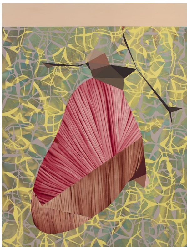
Daniel Verbis. Psique , 2020-21. Acrílico sobre lienzo, 195 x 130 cm.

“La belleza inasible no se puede retratar. Como la pureza, es un ideal. Cuando el manto envolvente se rompe (como se rompe la crisálida) en el acto gozoso o liberador del cuerpo, la naturaleza se muestra en toda su crudeza. Desnuda, hecha mirada, despojada del manto que proscribía su visibilidad, la belleza pierde su carácter virginal, pierde su condición ideal y se convierte en el espectáculo de una fugacidad, en el resplandor de un instante, en una electricidad estática superficial. Vemos pues, que la belleza, que la iridiscencia cromática de esas psiques que aparecen y desaparecen en la sinuosidad de su vuelo fugitivo como en una victoria alada ( El paciente insecticida , 2018) o en una buenaventura angelical ( Psique , 2020-21), es algo temporal, una brevedad, una lejanía del ser que acaba abandonándonos y que sólo se puede recordar o imaginar.