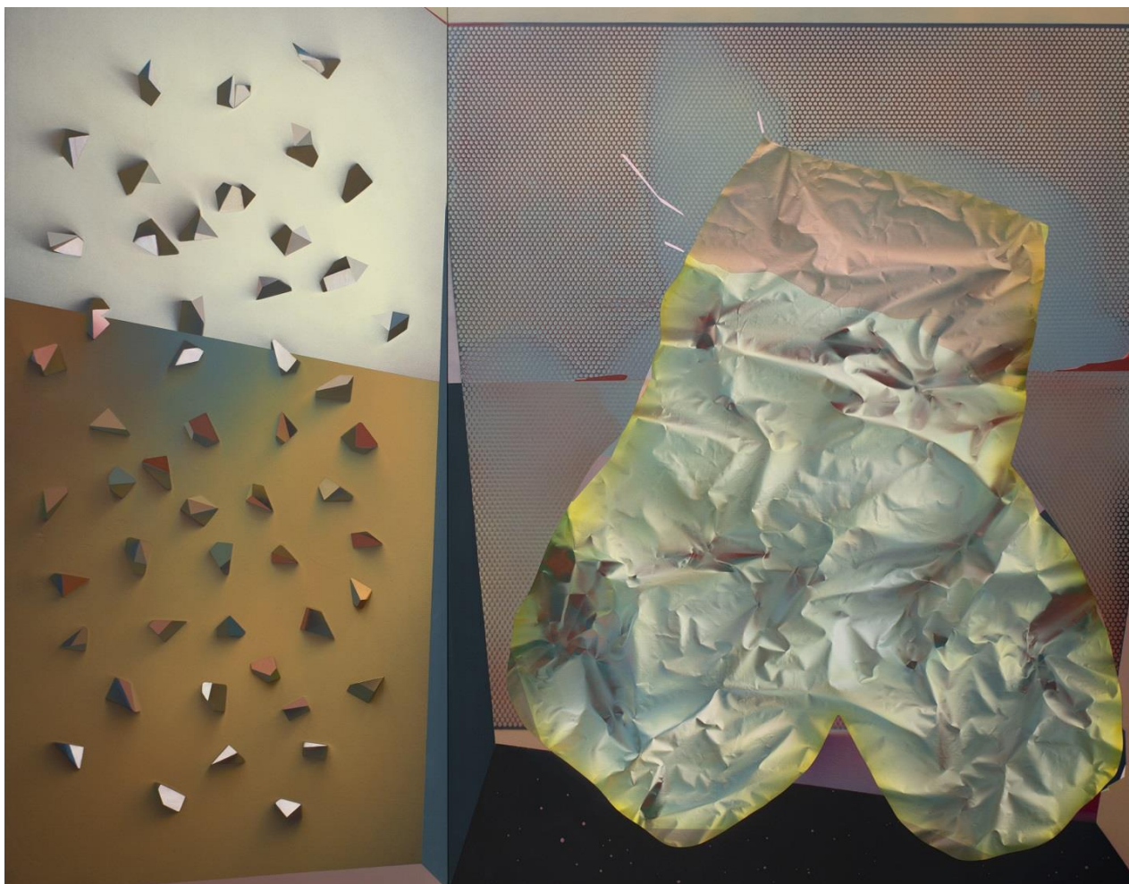
Daniel Verbis. Dios del cielo , 2021. Acrílico sobre lienzo y madera, 243 x 312 x 10 cm.