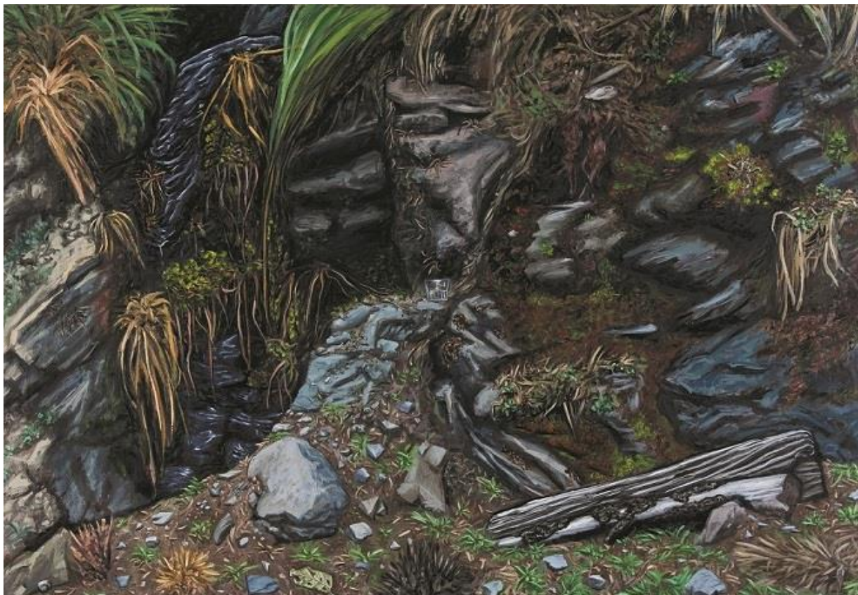
Idoia Montón. Minas de Arditurri IV , 2006. Óleo y acrílico sobre tabla, 100 x 146 cm.

Montón entiende el arte como una forma de resistencia frente a la violencia, como un intento de actuar sobre la realidad. La función del arte es su poder de transformación, ha señalado la propia artista. De ahí el profundo arraigo de su obra con la experiencia y la vida en común, y también esa firme desconfianza frente a las convenciones y las fórmulas que a lo largo de los años le ha llevado a buscar un nuevo punto de partida mediante la exploración de diferentes registros pictóricos: del collage bidimensional al realismo, pasando del magicismo a la crítica política, del realismo al barroco.