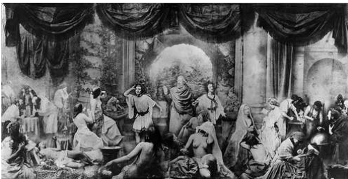
Oscar Rejlander. Los dos caminos de la vida , 1857

Investiguemos na web sobre Oscar Rejlander e localicemos estas obras que representan a versión fotográfica e pictórica dun mesmo tema: