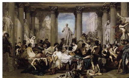
Thomas Couture. Los romanos de la decadencia , 1847

Continuemos a investigación buscando exemplos de autores e obras doutras correntes como pictorialismo, dinamismo, novo realismo... correntes estéticas denominadas clásicas. A continuación buscaremos información sobre correntes estéticas modernas na fotografía, como a abstracción ou o surrealismo, sobre os seus autores e características.