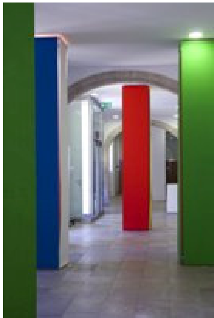
Mar Vicente. Columnas (Composición II) , 2013

Columnas (Composición II) , 2013, é unha obra realizada especificamente para o vestíbulo do MARCO, un lugar habitual no tránsito de visitantes. Nun primeiro golpe de vista, o espazo aparece cheo de columnas, pero pouco despois a súa percepción como elemento arquitectónico substitúese pola de teas pintadas, e as connotacións pictóricas eliminan, dalgún xeito, a idea de columna e a súa función estrutural. Ademais, nunha continuidade de estímulo-resposta, a presenza do espectador fai que as teas, penduradas do teito, se movan lixeiramente ao pasar ao seu carón.