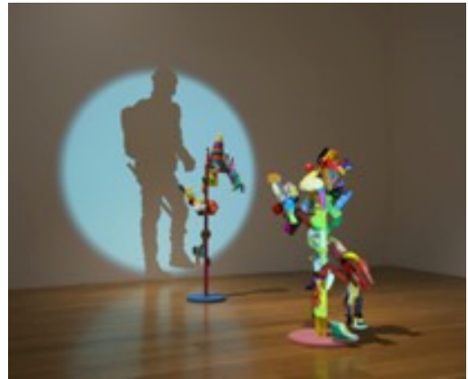
Carlos Álvarez Gil. Papá, de mayor quiero ser policía! , 2013

Primeiro fixámonos nesa escultura feita de xoguetes, e observamos os elementos que a compoñen. Cando proxectamos a luz, descubrimos que os obxectos son o pretexto para a creación dunha imaxe-sombra. Esta instalación permítenos falar da idea de xogo e xoguete.