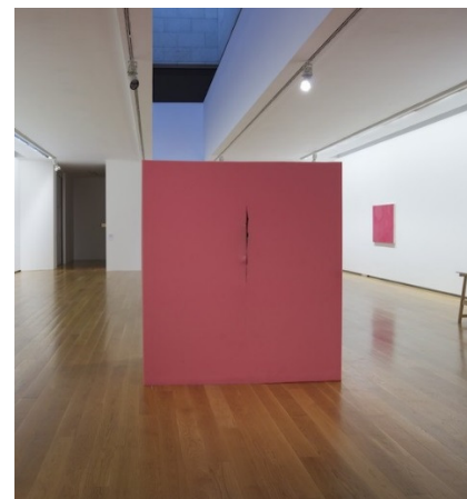
Diego Vites. Concetto spaziale , 2013

Grazas á manipulación dos nosos bloques comprendemos algunhas características do material co que está feita esta peza: a súa flexibilidade, peso e forma. Falamos do seu tamaño e dos seus posibles usos.