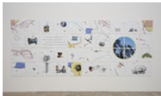
montenoso. Xeografías do mancomún , 2013

Un xigantesco crebacabezas introdúcenos nun lugar coñecido por todos: un monte. A través das diferentes pezas do crebacabezas e doutros obxectos que completan a instalación falamos dos montes e bosques galegos e da importancia do coidado e do respecto á natureza.